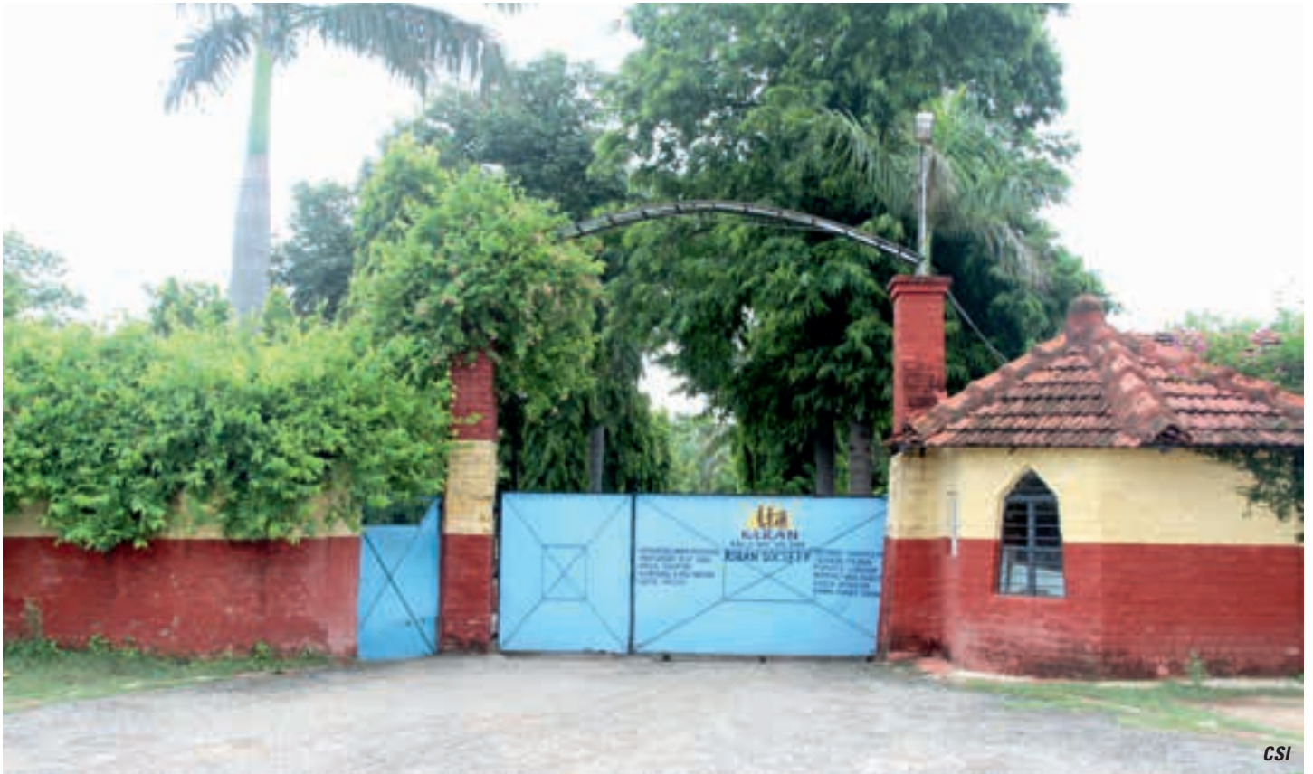
Bienvenue au Kiran.