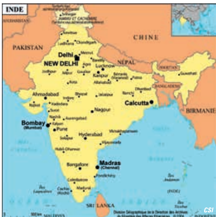
Pondichéry au Sud de Madras et Vanarasi au Nord-Est.

Les objectifs principaux de cette mission étaient de découvrir le travail des deux partenaires Rawttakuppam Hemerijchx Centre (à Villupuram, HRC) et Kiran Village (KIRAN) et de connaître le contexte de l'Inde. Mais il fallait aussi informer les deux partenaires sur la stratégie de CSI et les conditions de collaboration. En même temps, nous avons dû identifier ensemble un projet pilote.