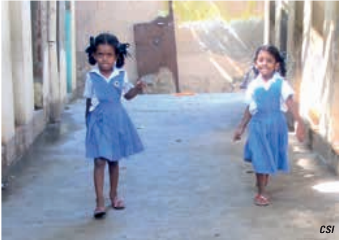
Les toilettes de l'école St Antoine sont dans un état très dégradé.

qui est le plus grand district du Tamil Nadu. Après avoir visité une grande partie des activités qui bénéficient directement à une population d'environ 40.000 habitants dans une trentaine de villages, nous avons eu l'occasion de voir des écoles dans les quartiers pauvres. Normalement, le gouvernement soutient la mise en place d'infrastructures, mais ne participe ni à la maintenance, ni à l'acquisition d'équipements ou de matériel pédagogique. Les écoles visitées étaient toutes dans un état pitoyable et il est très vite devenu clair qu'un engagement à ce niveau serait utile. Les sœurs missionnaires étrangères, congrégation fondatrice du HRC, gèrent une école primaire dans le quartier d'Ambdekar Nagar à Pondichéry. Un volet spécial de l'engagement du partenaire consiste à donner accès à l'éducation aux dalits, aux hors-castes et aux tziganes. Nous avons pu identifier les besoins de cette école. Le projet pilote retenu et accordé par le gouvernement luxembourgeois en janvier 2015 prévoit l'amélioration des conditions sanitaires à l'école St Antoine pour un budget total de 36.457,14 €. Fin 2015, environ 850 enfants bénéficieront des nouvelles installations.