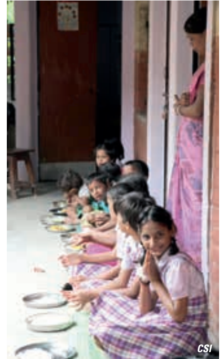
Les enfants au Kiran reçoivent un repas tous les jours.

CSI fera de son mieux pour que le soutien donné à l'école St Antoine et à Kiran Village permette à tous les jeunes concernés de voir ce « rayon d'espoir pour la vie ». Merci de nous aider à y parvenir en soutenant nos nouveaux projets en Inde.