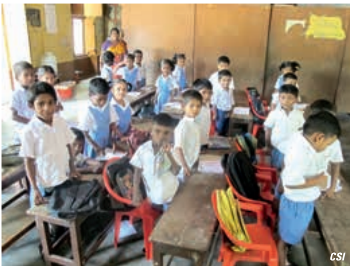
« Apprendre fait du plaisir même dans des salles de classe pauvres. »

Ce travail de conception a aussi été confié aux responsables du Kiran Village (près de Vârânaśi) vers où nous nous sommes dirigées après avoir passé 3 jours au Sud. Le Nord de l'Inde, à en croire les guides touristiques, est plus impressionnant et compte des trésors issus d'une riche histoire. C'est peut-être vrai, mais nous n'avons rien vu de tout cela. Le Nord est différent du Sud, la densité de la population est plus importante et la pauvreté est encore plus présente. Kiran Village, comparé à ce que les « Amis de l'Inde » ont pu connaître au tout début de leur engagement dans ce pays, s'est énormément développé. Kiran, ce